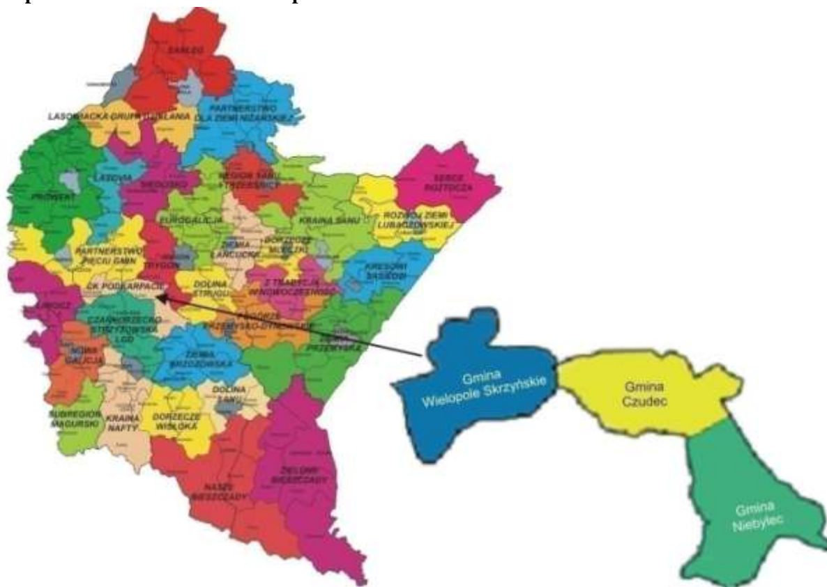
Mapa Obszaru LGD C.K. Podkarpacie